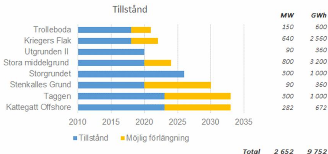
Figur 3: Befintliga svenska tillståndsgivna projekt. Sverige har god potential, men behöver agera för att ta den tillvara. Den blå stapeln markerar när tidsfristen för färdigställande går ut och den gula hur lång förlängning projekten som mest kan få.

Idag finns drygt 9 TWh tillståndsgivna vindkraftsprojekt i svenska farvatten och några inväntar tillstånd. De existerande tillstånden börjar dock förfalla, med start kring 2018-20236. Skulle detta, ske tappar man en stor del av potentialen och det blir svårt att få till stånd de erfarenheter som krävs för en utbyggnad i Sverige i perspektivet 2025-2035.